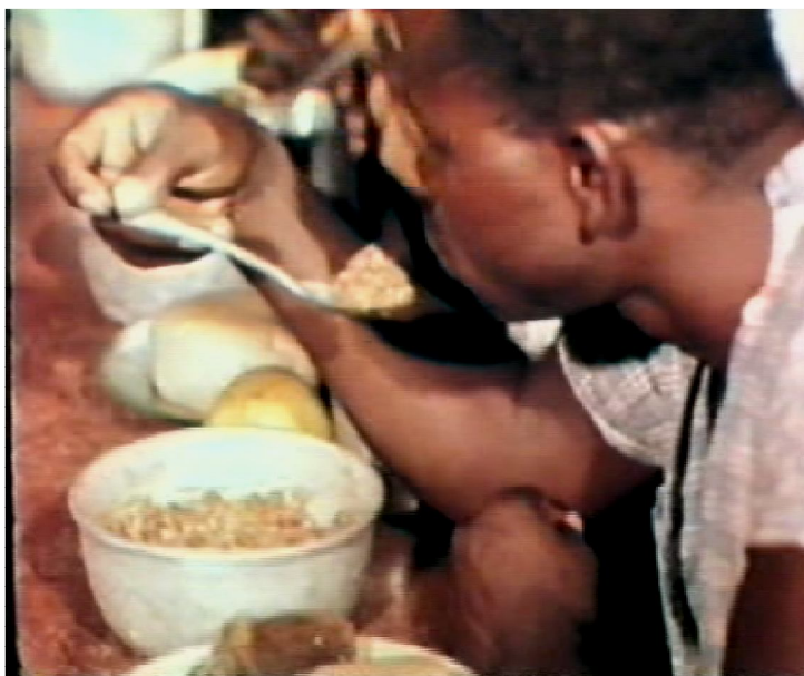
Fig. 4 - Fotograma d' O Romance do Luachimo. Lunda, Terra de Diamantes , 1969