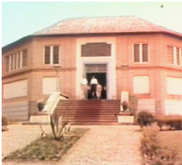
Fig.3 - Fotograma d' O Romance do Luachimo. Lunda, Terra de Diamantes, 1969.

O Museu do Dundo é criado em 1936 e é um museu etnográfico que alegava procurar preservar as culturas nativas face à presença da 'modernidade' (Fig. 3). Ao mesmo tempo, é o cartão de visita para as visitas institucionais e para a imagem internacional de Portugal, onde a existência de indígenas tradicionais e tribalizados significa a necessidade em continuar a 'civilizar' o Outro. Conjugando propósitos políticos com motivações românticas, o Museu é retratado no filme a partir das suas Salas e que expõem os objetos trazidos das campanhas de recolha nas aldeias. Também se destaca a Aldeia do Museu criada em 1943 e onde ocorrem as Festas Folclóricas. Nestas ações, as culturas nativas são idealizadas como sendo 'tradicionais', 'autênticas' e antigas, e é com base nesta ideia de 'Tradição' que se legitima a presença colonial na Lunda.