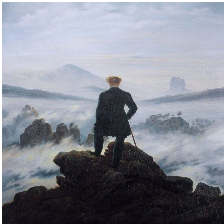
Fig. 1 - Caminhante sobre o mar de névoa (1818).

Tendo em mente tais aspectos concernentes ao princípio da tradução, é possível manter uma relação com o que precede o objeto de estudo, mas, é claro, sem esgotar o princípio de ascendência ao declive do intrínseco processo de criação. O romance O céu que nos protege repousava em seu tempo do pós-guerra, mais especificamente em 1949 — data de seu lançamento. Bertolucci, em outro tempo posterior, quando diante do romance de Bowles, ainda não tinha visto O céu que nos protege em princípio de transcrição para a linguagem cinematográfica. Em Bertolucci e Bowles – The sheltering sky de Lívio Negri (1990, 53), constata-se que Bertolucci viu outra coisa: a pintura de Caspar David Friedrich — O viajante sobre o mar de névoa (1818), assim como Os Penhascos de Rügen (1818). Antes de extrair cinema do romance, Bertolucci pensou a pintura, para assim, pensar o filme. O viajante de Caspar David Friedrich seria o casal do romance (Port e Kit), só que agora não sobre um mar de névoa, mas sob um céu cuja imensidão talvez não fosse garantia de manto protetor, mas revelador dos interstícios de suas respectivas valorizações subjetivas.