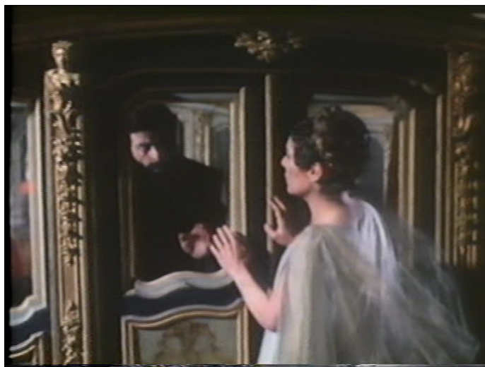
Imagem 3: Momento lírico da Oitava Canção de A Ilha dos Amores : uma ópera?

Retenhamos esta ideia de que esta ópera é vista pelo realizador como um momento “arreatadamente lírico” necessário nesta colagem de grandes dimensões ( Pousada , um filme com menos de 20 minutos, era-o de uma forma muito mais rápida e em pequenas dimensões), que deve “libertar temporariamente” o espectador do drama.