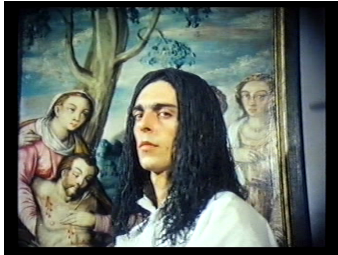
Imagem 1: A música que faz ver em Pousada das Chagas : “Pois quem pode pintar a vida ausente?”: o som de um violino “chama” o ator para dentro do quadro.

de se virar par a câmara como que chamado pelo som de um intervalo rápido de segunda ascendente produzido pelo violino enquanto o órgão eléctrico tece uma harmonia dissonante.