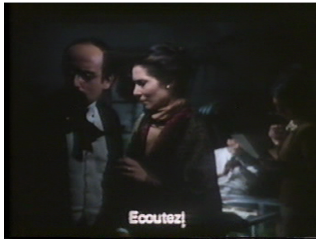
Imagem 4: Música e iluminação “expressionistas” em A Ilha dos Amores : “Ouçam!”

alemão e do expressionismo: “A mesa central em diamante, iluminada por dentro, representava um pouco a pedra filosofal do romantismo alemão, que reencontramos em certos filmes expressionistas. Era uma mesa espírita, com as vozes falantes dos ausentes, os postais, as fotos, as cartas do Moraes, um diamante em que se via o passado e o futuro.”