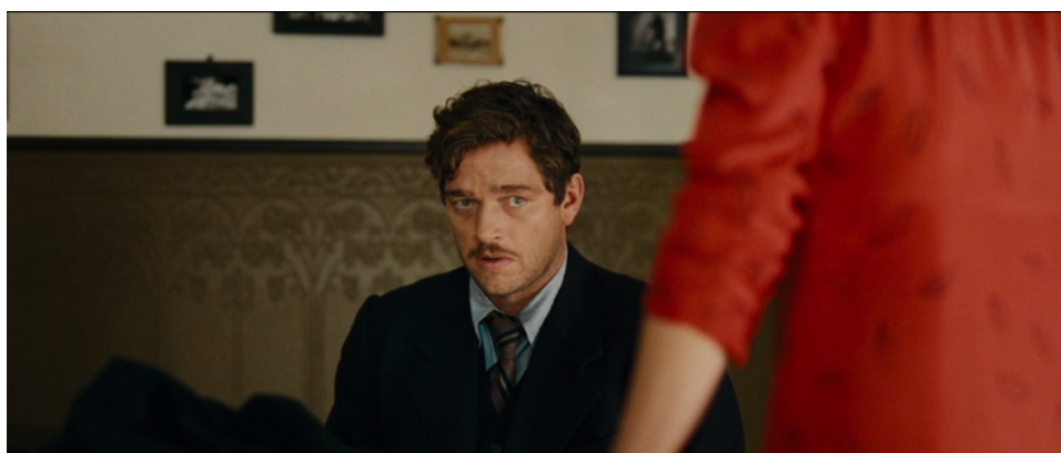
Figura 1. Trecho do filme

potente quanto à de sua mulher. Então, ele vê os números tatuados em seu braço e se dá conta de quem está na sua frente é a própria Nelly (Figs. 1-3).